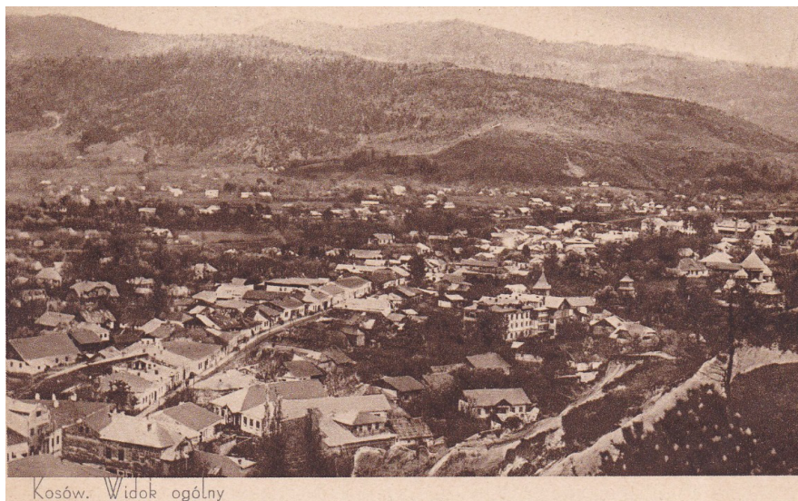
Косів, панорама, автор листівки: В. С. П., приватна колекція авторки.

Таким чином Косів та клініка Тарнавського були прорекламовані в довоєнній пресі, що було набагато ефективніше ніж звичайні оголошення, на які зрештою лікар Тарнавський не шкодував грошей й регулярно розміщував рекламу в щоденних газетах про регіональну діяльність, а також у загальнопольських (в т.ч. «Торгова Газета», «Голос Варшави», «Республіка»). Знаючи слабкість польських курортників до зарубіжних санаторіїв, підкреслював переваги Косівського району, порівнюючи його з Мераном 10 . Цьому було наукове обґрунтування, оскільки клімат Косова та околиць (Пістинь і Кути), був дуже наближений до клімату відомого тірольського курорту. Середня річна температура в Косові була 9–10°C, а в Мерані – 11°C 11 .