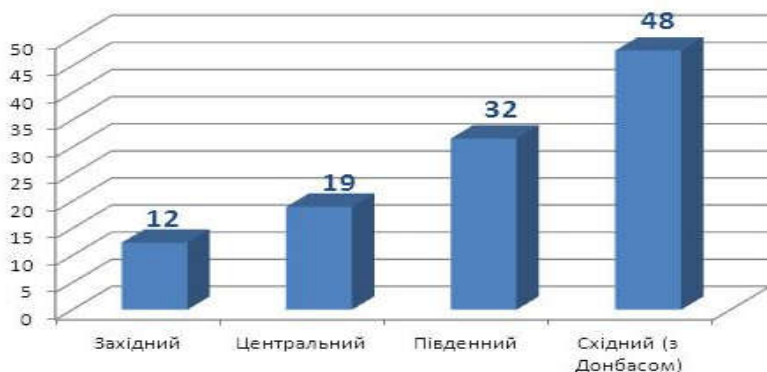
Графік 1. Індекс результативності російської пропаганди макрорегіонів України

Найбільше російська пропаганда (крім Донбасу) впливає на жителів Харківської (індекс РРП = 50) та Одеської області (індекс РРП = 43). Значно краща ситуація у Херсонській, Миколаївській, Дніпропетровській та Запорізькій областях (індекс РРП = 28-29). У Києві ситуація не відрізняється від інших територій Півночі та Центру України (індекс РРП = 19). Проте опитування вказує, що дуже серйозна контрпропагандистська робота повинна бути зосереджена у Харківській та Одеській областях.