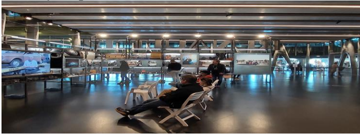
Рисунок 2. Внутрішній простір Музею середземноморських цивілізацій у Марселі

Наративи Музею середземноморських цивілізацій у Марселі присвячені країнам Середземномор'я, здійснюючи внесок у постійний діалог населення цього регіону. У центрі музейного наративу – середземноморські цивілізації, а також зв'язки регіону з Європою. Музей містить постійну і тимчасові експозиції, дослідницький центр, організовує наукові конференції.