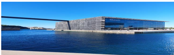
Рисунок 1. Музей цивілізацій Європи та Середземномор'я в Марселі

Символічне розташування музею на середземноморському узбережжі Франції підтверджує стратегічну роль Марселю в інтеграції середземноморських народів і культур, зміщуючи європейський фокус у бік географічного півдня. Географічне розташування музею створює мости, які простягаються до інших місць Середземномор'я, створюючи діалог між громадами як на місцевому, регіональному, так і на глобальному рівні. Метою музею є створення «нового бачення Середземномор'я, яке не нав'язує точку зору європейців» (Freschel, 2013). Це твердження означає не лише середземноморський фокус, але й новий спосіб концептуалізації Середземномор'я. Нове Середземномор'я – це простір з власною виразною ідентичністю, зосередженою навколо