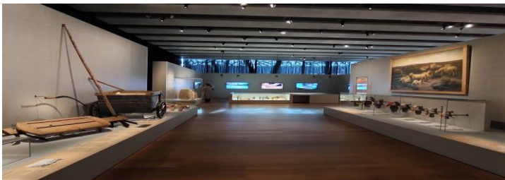
Рисунок 3. Експозиція, присвячена сільському господарству у Музеї середземноморських цивілізацій у Марселі

Наративи Музею середземноморських цивілізацій у Марселі присвячені країнам Середземномор'я, здійснюючи внесок у постійний діалог населення цього регіону. У центрі музейного наративу – середземноморські цивілізації, а також зв'язки регіону з Європою. Музей містить постійну і тимчасові експозиції, дослідницький центр, організовує наукові конференції.